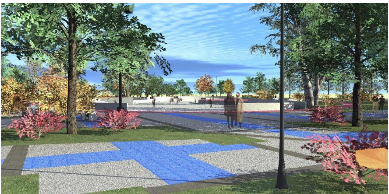
Maqueta virtual Parque Vergara II etapa