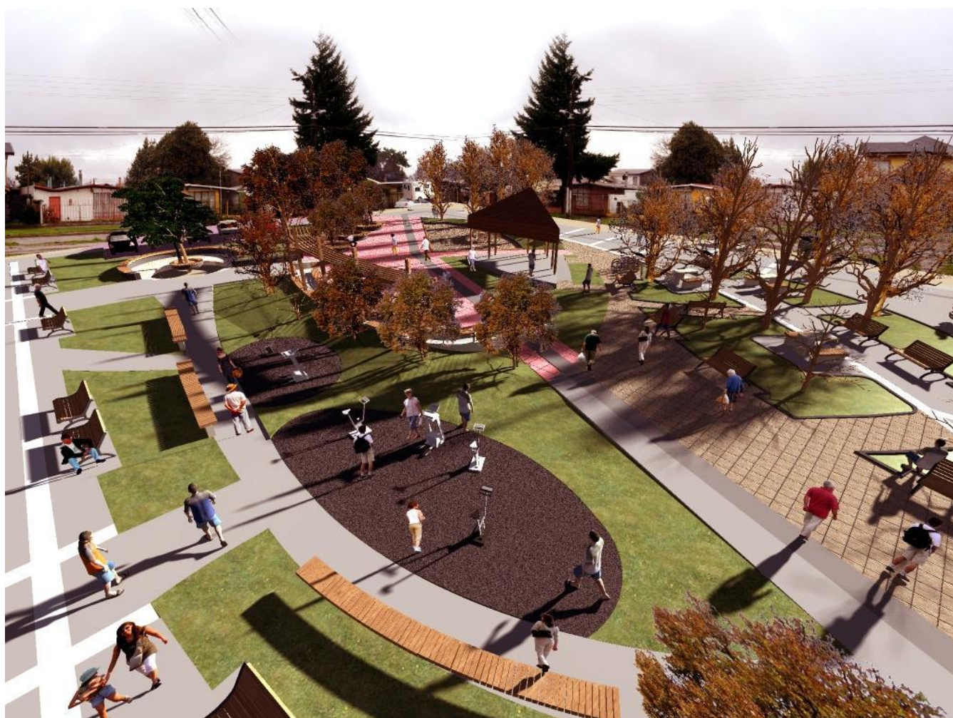
Imagen de Diseño Plaza del adulto Mayor

A continuación se expone una descripción de los proyectos de inversión realizados durante el año 2011 y otros actualmente en ejecución. Esta revisión considera la sistematización de acciones que atañen fundamentalmente al equipamiento e infraestructura urbana y rural disponible, que con diversa intensidad (vecinal, comunal, intercomunal) se han desarrollado al interior del territorio comunal dando cuenta del CRECIMIENTO que busca ser reforzado y complementado durante la presente administración en pro de una mejor calidad de vida para todos los Angolinos.