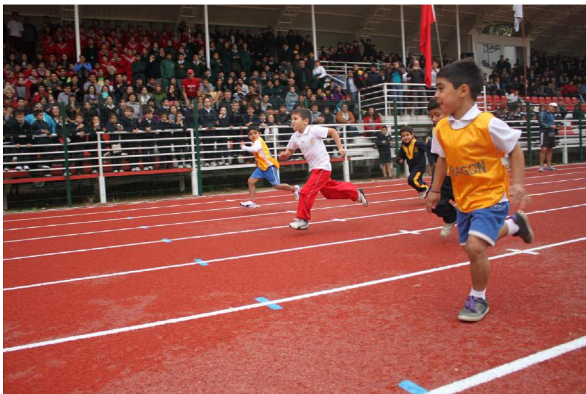
Inauguración Pista Atlética